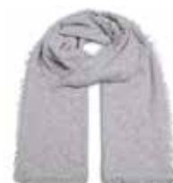
Steingrau Meliert 2831