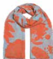
Dahlia-cs Maxi Caribbean Sea 2573