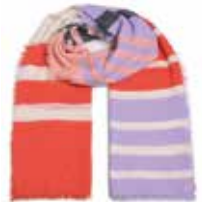
Unevi-cs Pina Colada 1050