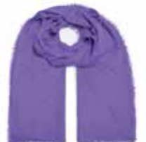
Passion Flower 2306