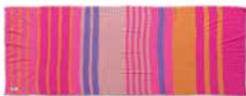
Unevi-cs Neonpink 239, gelegt