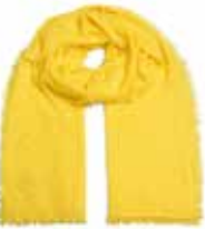
Yellow Lilly 1100