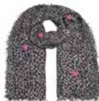
Leo-cs Stars Brown 262, Sterne Pink