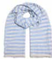
Milky Sky 2425