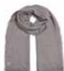
Grey Flannel 2832