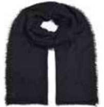
Black 280 Pailletten in Silber