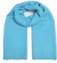
Blue Lagoon 2478