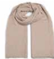
Cookies & Cream 2690