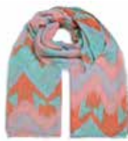
ZigZag Caribbean Sea 2573