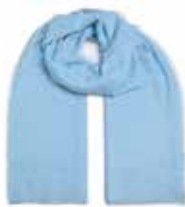
Swimming Pool 2421