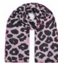
Leo-cs Big Black 280