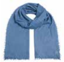
Infinity Blue 2414