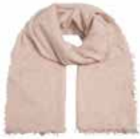
Light Beige Melange 2691