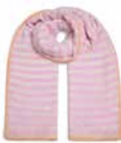
Strawberry Shake 2248