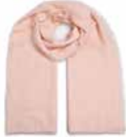
Strawberry Cheesecake 1010