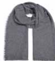
Dunkelgrau Meliert 282