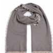
Grey Flannel 2832