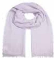
Snowy Sky 2851