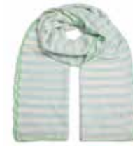
Mint Sorbet 2552