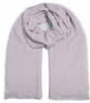
Hellgrau 284 Pailletten in Silber