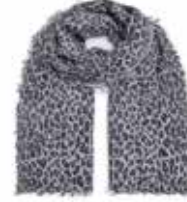
Leo-cs Schwarz 280