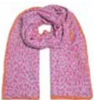
Feli-cs Leo mit Stitching Pink 223

Material: 100% Cashmere, gestrickt und gefilzt, mit Stitching-Kante, handmade in Nepal Größe: 210 x 85 cm