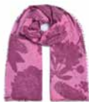
Dahlia-cs Maxi Pink 223