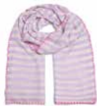
Lavender Mist 2276