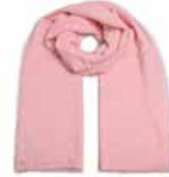
Rosy Quartz 2244