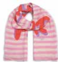
Strawberry Shake 2248

Schal Much More Amore-cs | Material: 100% Cashmere, gestrickt, gefilzt und mit Schriftzug „Much More Amore Por Favor“, handmade in Nepal | Größe: 210 x 85 cm