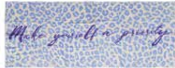
Leo-cs Priority Milky Sky 2425, gelegt