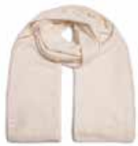
Sugar Swizzle 105