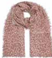
Leo-cs Nougat 2643