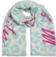
Leo-cs Priority Mint Sorbet 2552