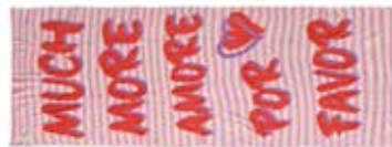
Strawberry Shake 2248, gelegt