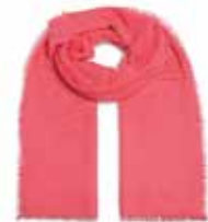
Pink Grapefruit 2233