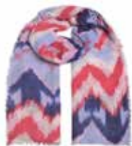
ZigZag Watermelon 2053