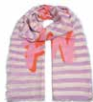
Lavender Mist 2276