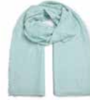
Mint Sorbet 2552