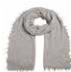
Light Grey Melange 285

Material: 100% Cashmere, Herrenschal, gestrickt und gefilzt, handmade in Nepal | Größe: 160 x 70 cm