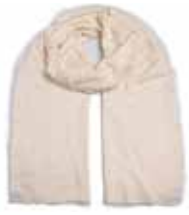
Creme 101 Pailletten in Silber