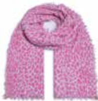
Leo-cs Pink 223

Schal Leo-cs | Material: 100% Cashmere, gestrickt und gefilzt, handmade in Nepal Größe: 210 x 85 cm