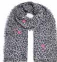
Leo-cs Stars Black 280, Sterne Pink