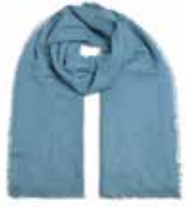
Brittany Blue 2477