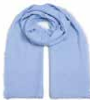
Milky Sky 2425