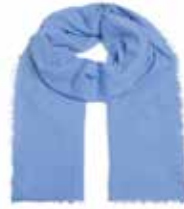
Hellblau 242 Pailletten in Silber