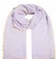
Snowy Sky 2851