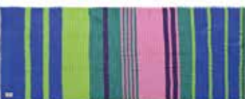
Unevi-cs Turmalin 2592, gelegt