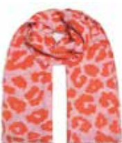
Leo-cs Big Tequila Sunrise 2111