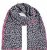
Feli-cs Leo mit Stitching Black 280