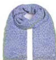
Feli-cs Leo mit Stitching Azurro 2401