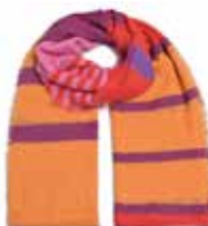
Unevi-cs Lipstick 2252