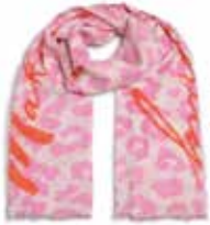
Leo-cs Priority Strawberry Shake 2248

Schal Leo-cs Priority | Material: 100% Cashmere, gestrickt und gefilzt, mit Leoprint und Schriftzug „Make yourself a priority“, handmade in Nepal | Größe: 210 x 85 cm