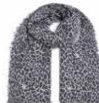
Leo-cs Stars Black 280, Sterne Silber