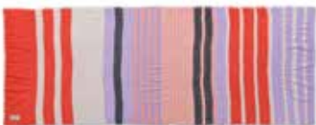
Unevi-cs Pina Colada 1050, gelegt