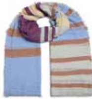
Unevi-cs Blue Grotto 2423