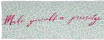
Leo-cs Priority Mint Sorbet 2552, gelegt

Schal Leo-cs | Material: 100% Cashmere, gestrickt und gefilzt, handmade in Nepal Größe: 210 x 85 cm