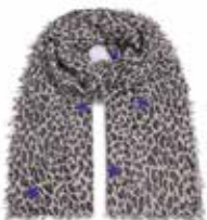
Leo-cs Stars Brown 262, Sterne Lila