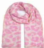
Leo-cs Big Strawberry Shake 2248

Schal Leo-cs Big | Material: 100% Cashmere, gestrickt und gefilzt, handmade in Nepal Größe: 210 x 85 cm