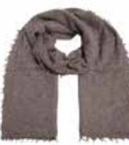
Coffee Meliert 2692