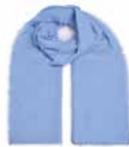
Blue Grotto 2423