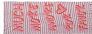
Lavender Mist 2276, gelegt