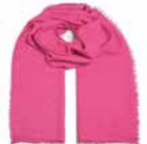
So Fuchsia 2210