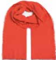
Aperol Sprizz 2035