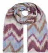
ZigZag Baileys 2602