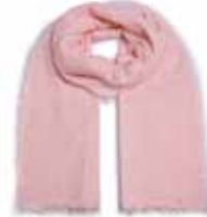
Strawberry Shake 2248