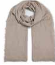
Taupe 2860 Pailletten in Gold