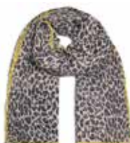
Feli-cs Leo mit Stitching Brown 262