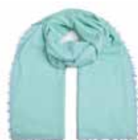
Caribbean Sea 2573