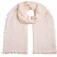
Sugar Swizzle 105