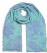
Dahlia-cs Maxi Swimming-Pool 2421