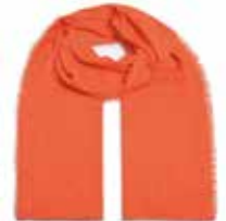
Tequila Sunrise 2111