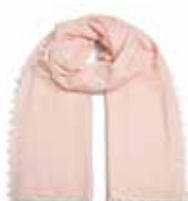
Strawberry Cheesecake 1010