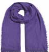
Purple Nights 2321