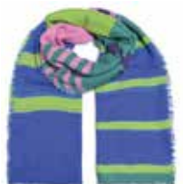
Unevi-cs Turmalin 2592