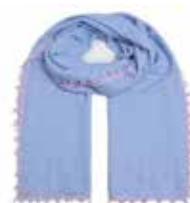
Milky Sky 2425