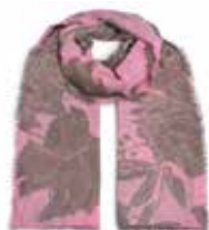
Dahlia-cs Maxi Magnolia 2247