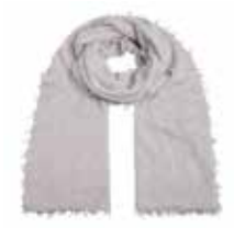
Steingrau Meliert 2831