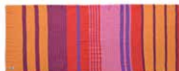
Unevi-cs Lipstick 2252, gelegt