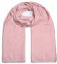
Rosy Quartz 2244