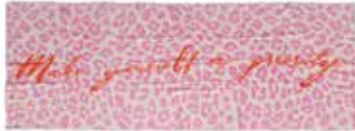
Leo-cs Priority Strawberry Shake 2248, gelegt