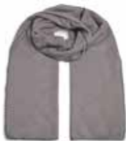
Grey Flannel 2832