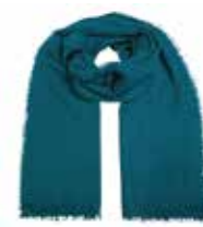
Stormy Sea 2484