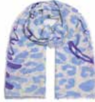
Leo-cs Priority Milky Sky 2425