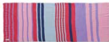
Unevi-cs Strawberry Shake 2248, gelegt