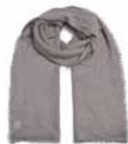
Grey Flannel 2832