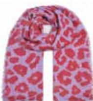
Leo-cs Big Watermelon 2053