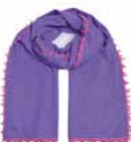
Passion Flower 2306