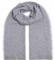
Grau Meliert 2830