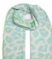
Leo-cs Big Mint Sorbet 2552