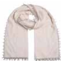
Sugar Swizzle 105

Schal BiFeli-cs | Material: 100% Cashmere, gestrickt und doppelt gefilzt mit abgesetzter Farbkante, handmade in Nepal | Größe: 210 x 85 cm