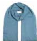
Brittany Blue 2477