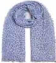
Leo-cs Azurro 2401