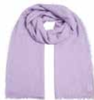
Lavender Mist 2276