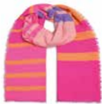
Unevi-cs Neonpink 239