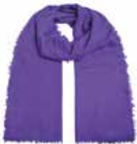
Deep Lavender 236