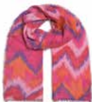
ZigZag Neonpink 239