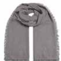
Grey Flannel 2832