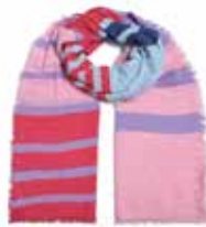
Unevi-cs Strawberry Shake 2249