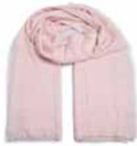
Lightrose 2240 Pailletten in Gold