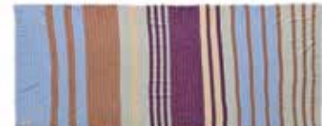
Unevi-cs Blue Grotto 2423, gelegt